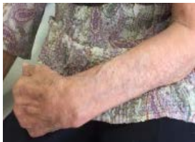
脳血管障害による 上肢（腕）の痙縮